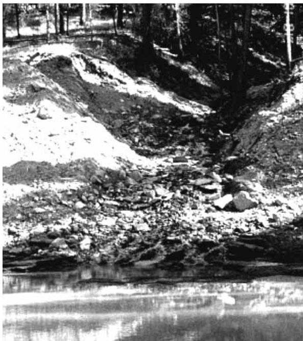
Figura 3. Cuerpo de agua contaminado con efluente minero.

El ingreso de los metales a los organismos ocurre mediante el agua, por el material particulado del aire, por los sedimentos y por los alimentos. Las vías más importantes de ingreso son la digestiva, respiratoria y dérmica, a las