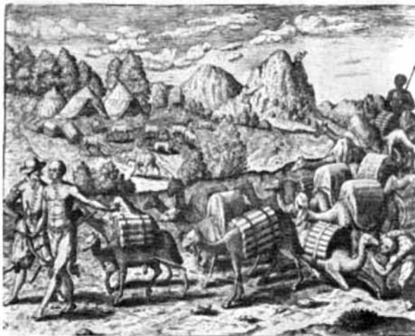
Figura 5. Llamas acarreado la plata de las minas de Potosí a la costa, con escolta armada, por los antiguos caminos de los incas. Grabado del libro "Americae" de Théodore de Bry's (1602).

En Córdoba se ha registrado una elevada incidencia de HACRE debido a la presencia de entre 1000 y 3000 ppb de As en acuíferos. En animales experimentales, se ha demostrado que el As se incorpora a través del tracto intestinal y en el hígado es mono- o dimetilado obteniéndose As orgánico de alta toxicidad que es excretado por orina, siendo el hígado y el riñón, los principales órganos afectados. Entre los efectos nocivos no carcinogénicos de este metaloide los más comunes son los asociados a piel: hiper/hipopigmentación, e hiperqueratosis; daños al sistema cardiovascular; alteraciones renales y hepáticas; desarrollo de neuropatías periféricas y encefalopatías; y su efecto como disruptor endocrino relacionado con la diabetes. Por otro lado, existe información epi-