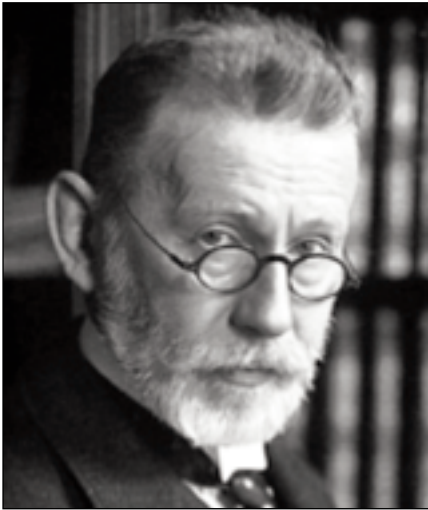
Figura 1. Paul Ehrlich

para reingresar al laboratorio en el que solía olvidarse las llaves.