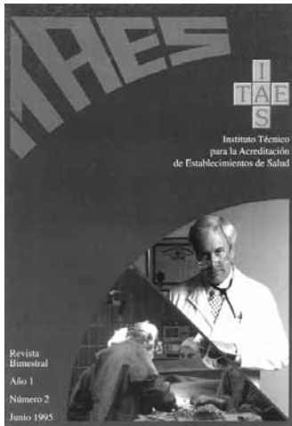
Número 2, Año 1995