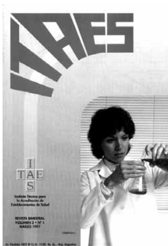
Número 1, Año 1997

enfrentar mejor la evaluación. Más adelante, en el año 2005, se decidió eliminar el resultado Acreditación con Mérito, para desalentar conflictos entre los usuarios, y sólo se dejó la Acreditación a secas.