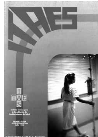
Número 4, Año 1998

Una Res. del Min. de Salud de Córdoba, la N°1789/02, establecía el Sistema de Acreditación voluntaria y mencionaba específicamente al Manual de ITAES y de la OPS, como ejemplos de estándares de ca-