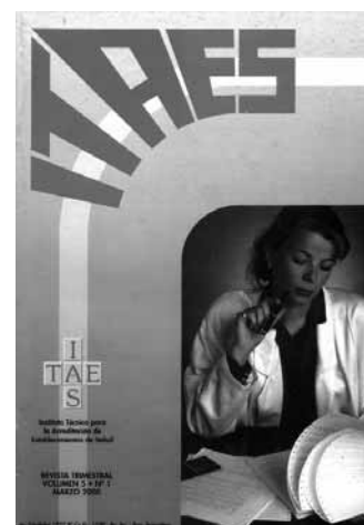
Número 1, Año 2000