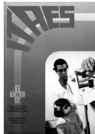
Número 2, Año 1999