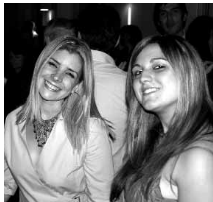
Equipo Editorial de La revista del ITAES